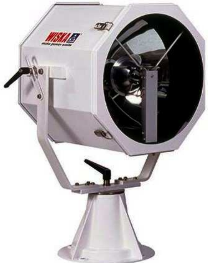
Versione con base di appoggio e sostegno