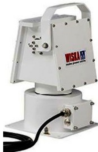
Telecomando per brandeggio e rotazione – Joy stick remoto