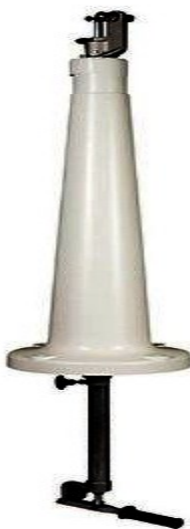
Base "CP" con comando inferiore per brandeggio e rotazione