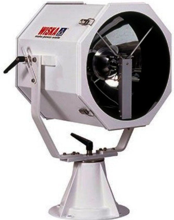
Versione con base di appoggio e sostegno