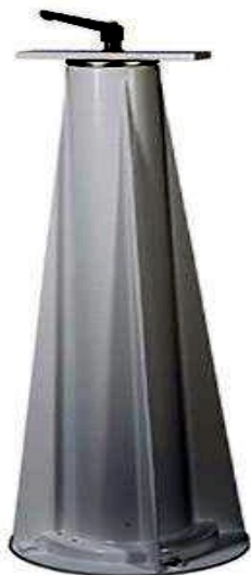
base di appoggio "DP" altezza circa 1 mt

La fotoelettrica viene fornita con la base "D" sopra raffigurata possono essere fornite le versioni alternative di seguito rappresentate. Eventuali soluzioni personalizzate possono essere prese in esame