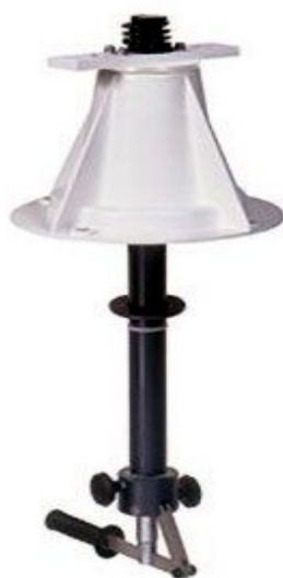
Base "C" con comando inferiore per brandeggio e rotazione